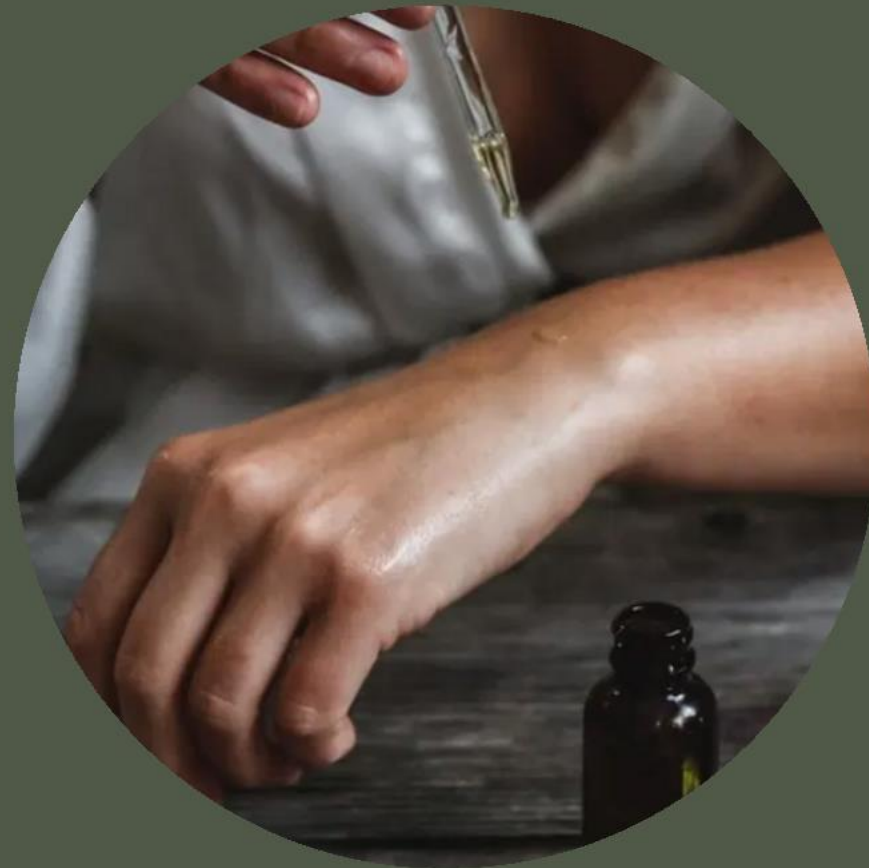
塗抹&擴香精油/ 配方油